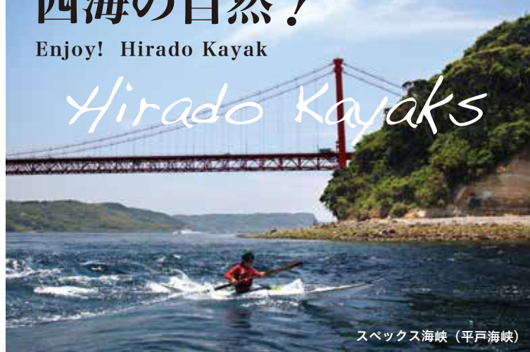
スペックス海峡 (平戸海峡)