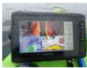
ECHOMAP Plus 75sv