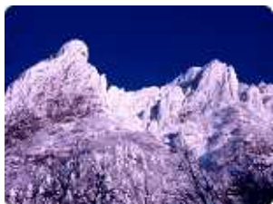
八ヶ岳 大同心 小同心