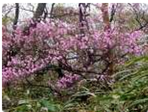
大崩山 あけぼのつつじ