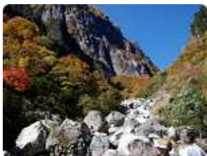
北アルプス 下ノ廊下