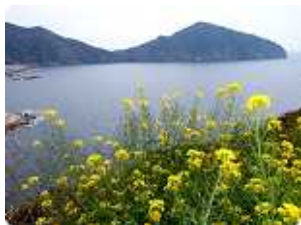
神崎半島 対馬最南端