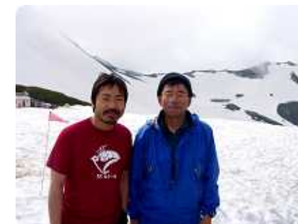
宇治長次郎役の香川照之さんと【2008.6 剣沢小屋にて】

参加にあたっては、「参加予約」、「参加料のお支払い(参加申込)」、「登山催行の決定」、「参加申込のお取消」、「安全対策」、「傷害保険」、「重要事項の説明」について、ご同意を頂いてからご参加していただくこととなります。詳しくは、申込時に紙面にて確認していただくこととなります。